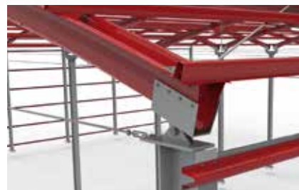
Fixação no pilar | Fixing on pillar | Fixation à la butée | Fijación en el pilar