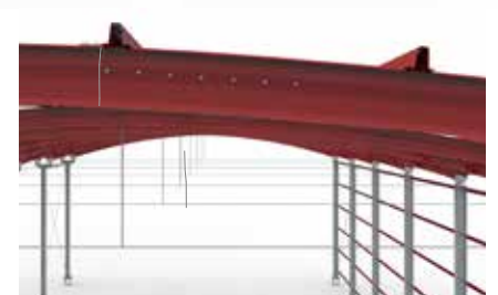
Ligação entre Madremax | Madremax connection Connexion Madremax | Enlace Madremax