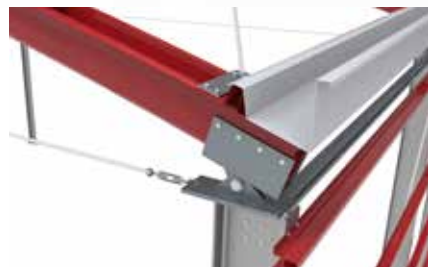
Caleira | Gutter | Gouttière | Canalón