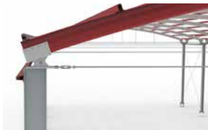
Raio de Curvatura | Radius of curvature Rayon de courbure | Radio de curvatura 30,5m